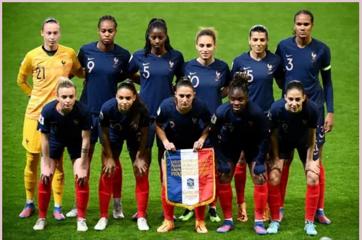
Équipe de France Féminine de football